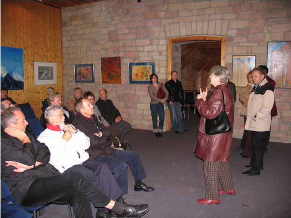
Führung durch das Hambacher Schloss