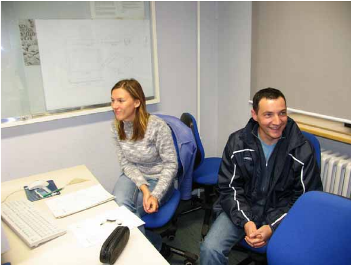
Auch ein Beruf für Frauen