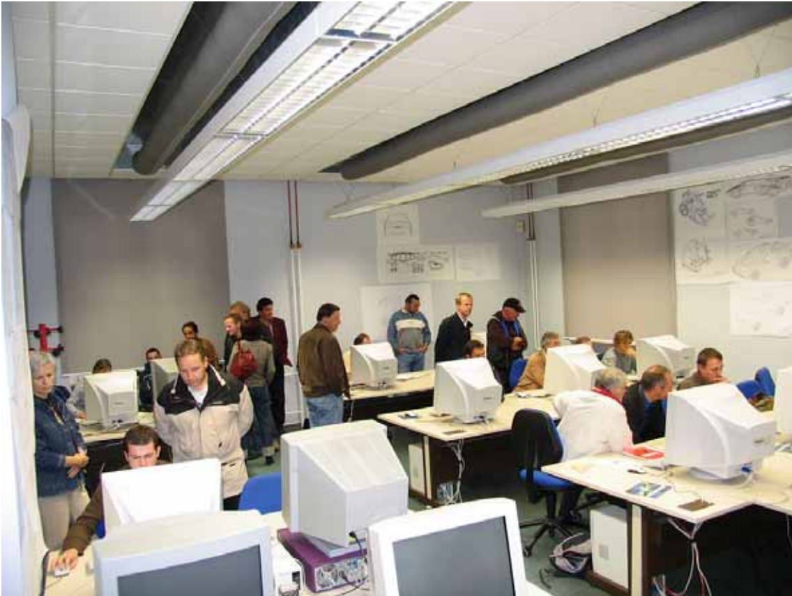
Die angehenden Carrosserietechniker arbeiten mit neuester Software

Die „Studienreisenden“ waren nach den zwei Tagen zwar müde, doch dafür um viele bleibende Erinnerungen reicher. Der Massstab für den Anlass im Jahr 2005 ist jedenfalls gesetzt und dürfte nur schwerlich zu übertreffen sein.