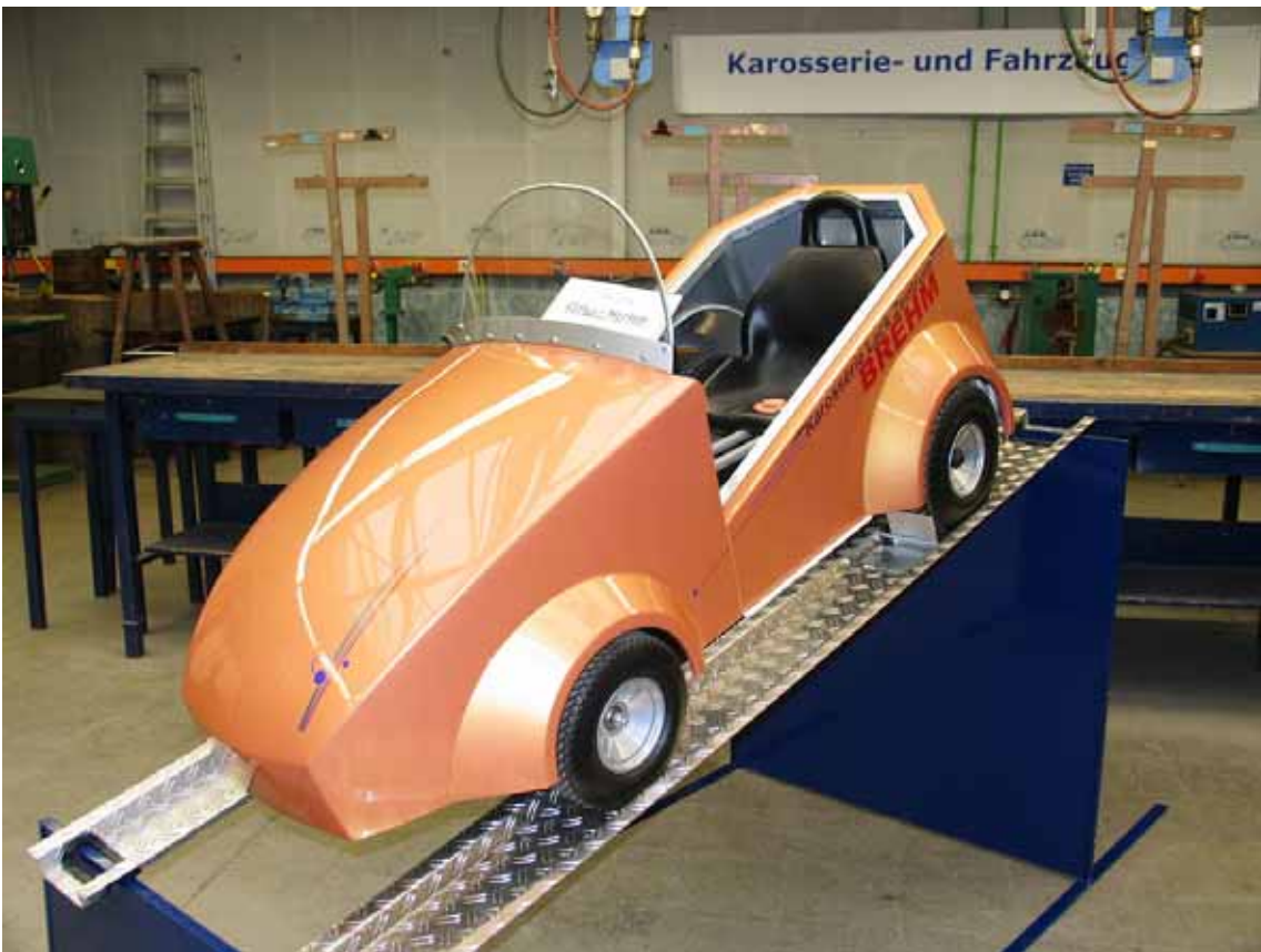
Das freut jeden Carrosseriespengler und Autolackierer