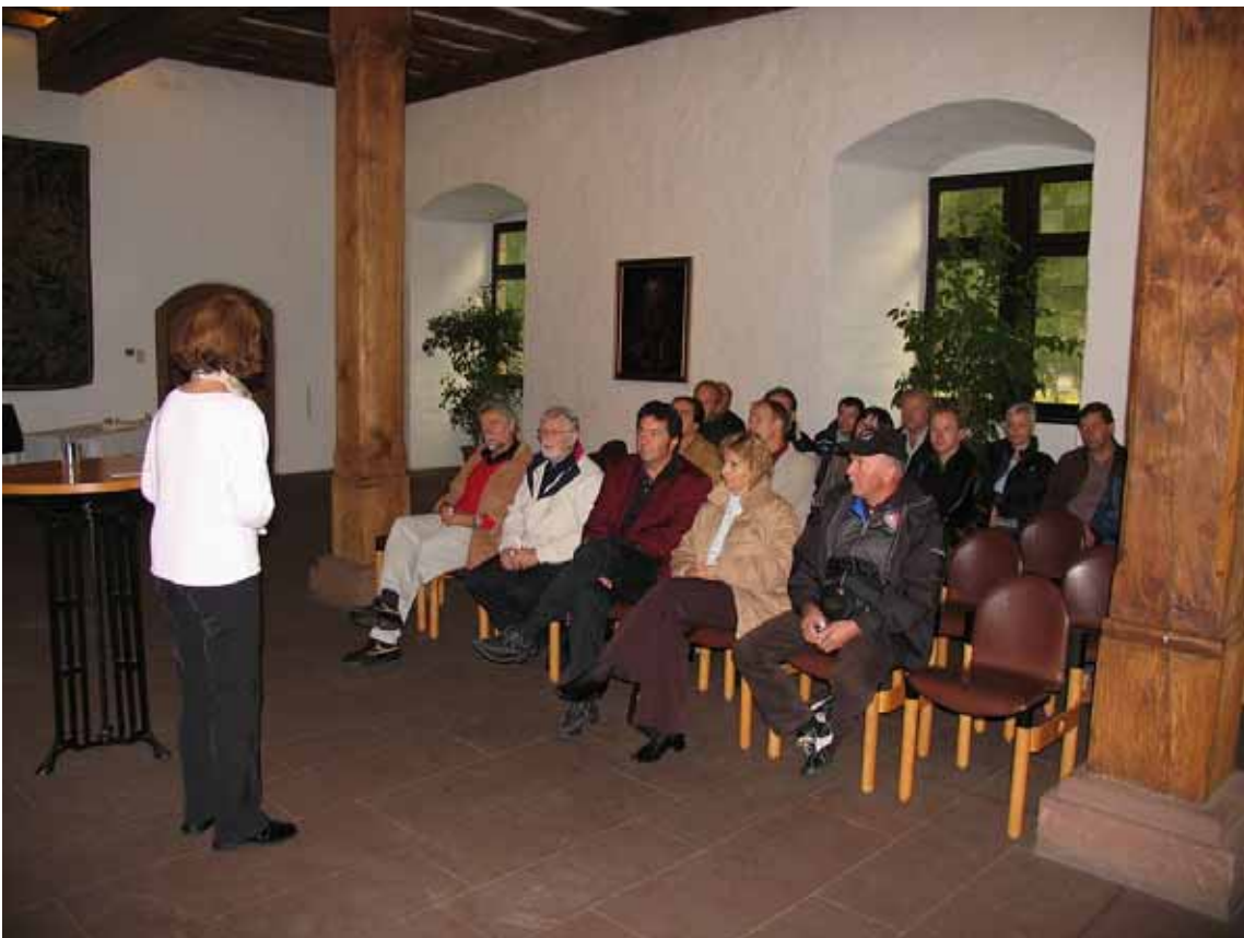
„Geschichtslektion“ im Casimirsaal