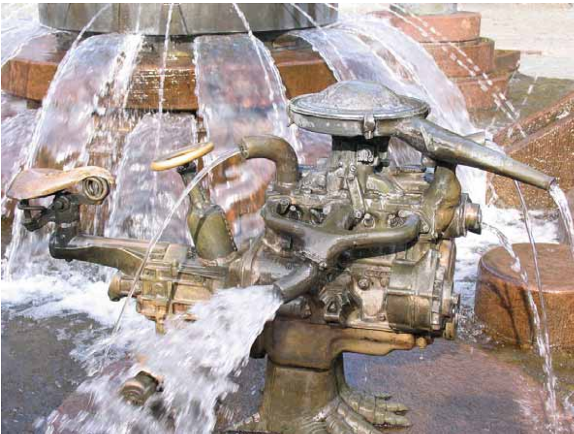
Kaiserbrunnen mit Opel-Symbol (die machten scheinbar auch Velos)