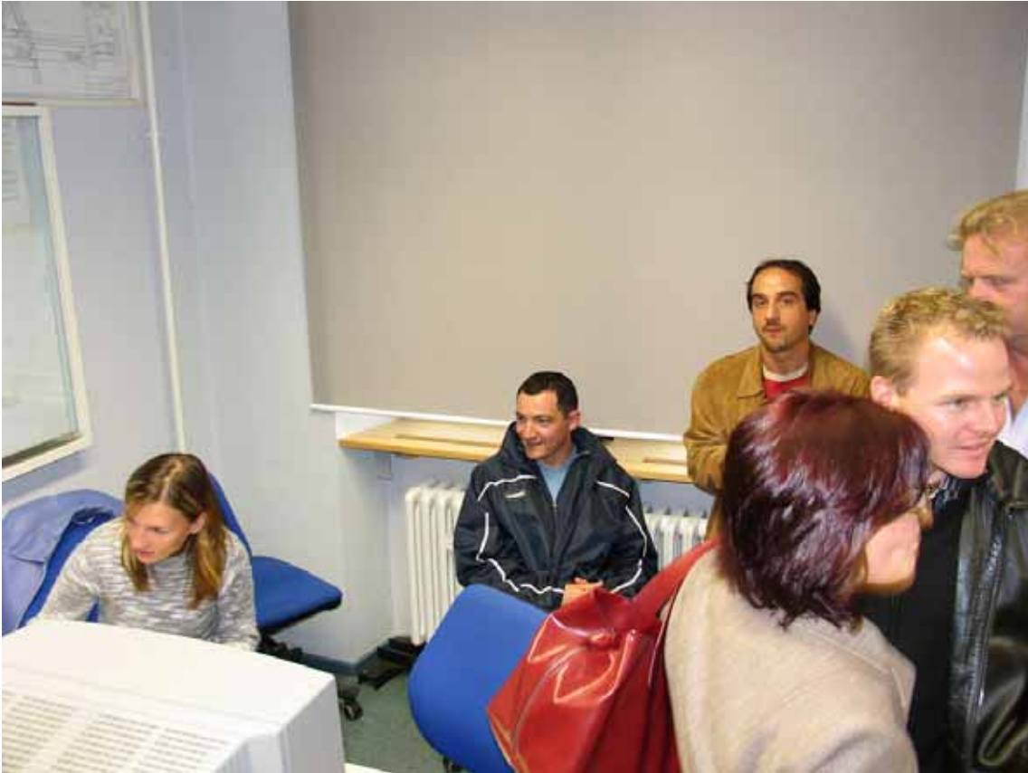
Den angehenden Technikern über die Schultern geschaut