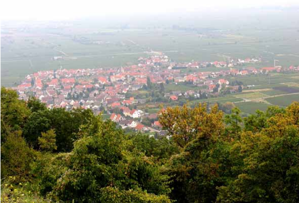
Blick vom Hambacher Schloss