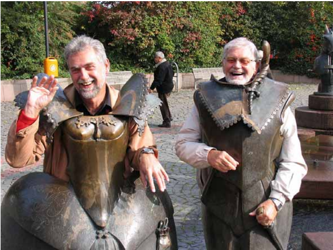
Vater und Sohn Gottesleben am Kaisersbrunnen