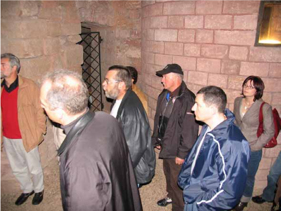
Unter dem Casimirsaal