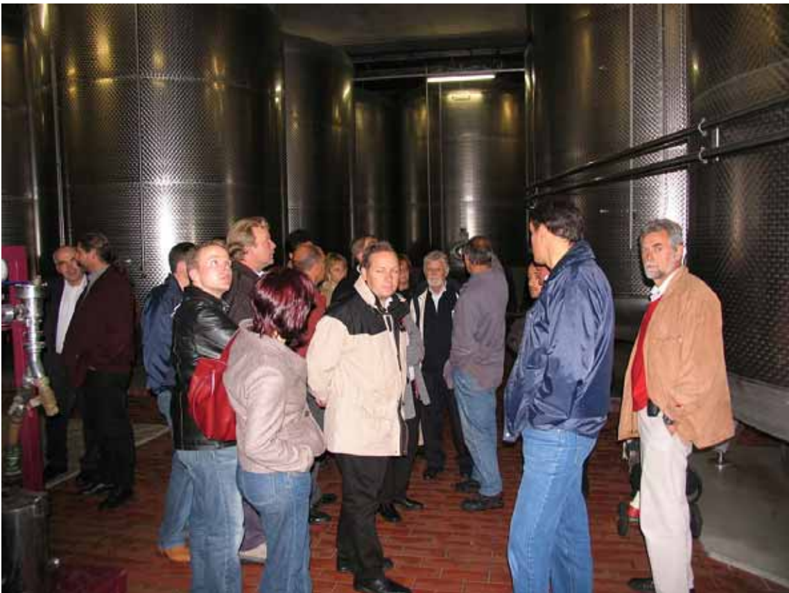
Fachsimpeln über ein anderes Thema.....