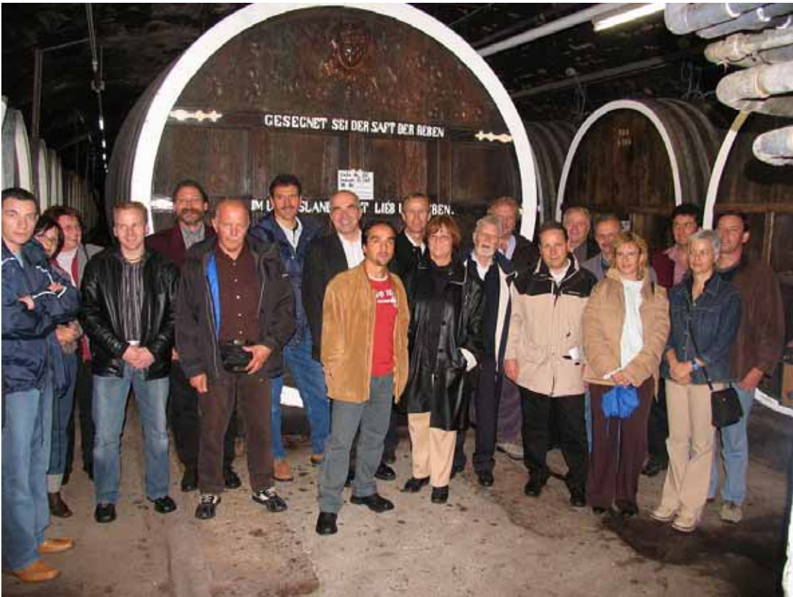
Vor dem über hundertjährigen Weinfass