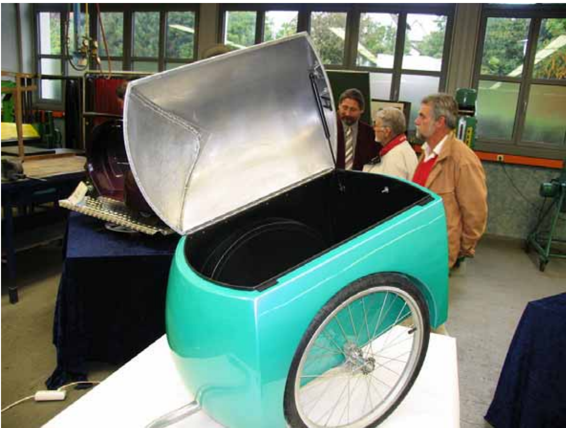
Noch mehr Freude kommt auf